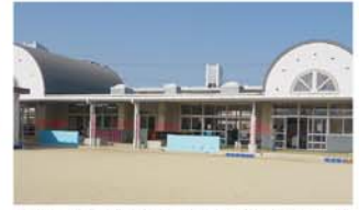
大分市立大在幼稚園 徒歩17分(約1.4km)