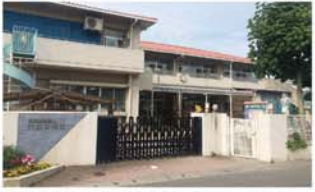
大在保育園 徒歩19分(約1.6km)