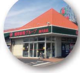
新鮮市場 西大分店 徒歩6分(約500m)