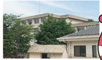
大在中学校 徒歩29分(約2.3km)