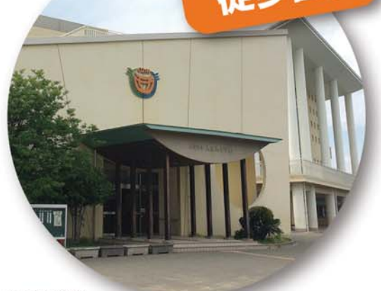
大在西小学校 徒歩8分(約600m)