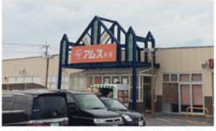
トキハインダストリアム大在 車で7分(約2.5km)