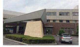
大分東部病院 徒歩10分(約800m)