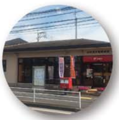
大分角子原郵便局 徒歩3分(約240m)