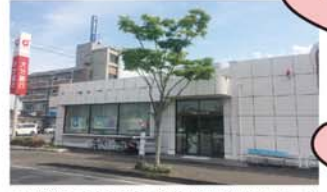
大分銀行 大在支店 徒歩13分(約1.15km)